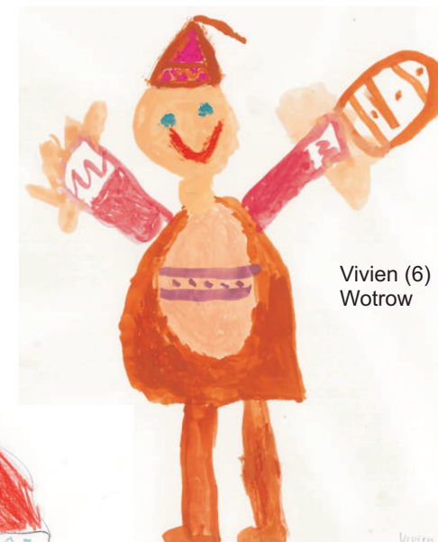
Vivien (6) Wotrow

„Potom je ta kula so swěćila kotruž je tón muž do wody preč čisnyl.“ Antonius (5)