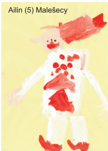
Ailin (5) Malešecy

„Te su tajke małe a su sej małe chlěbuški pjekli.“ Jakub (5)